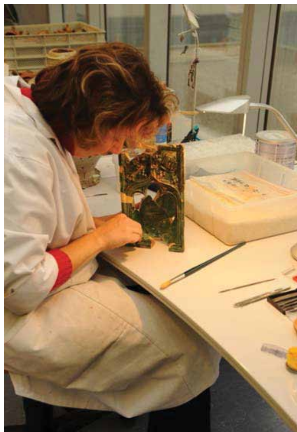
Het gewestelijk laboratorium voor archeologie

Archeologen bestuderen en interpreteren vervolgens de overblijfselen om de geschiedenis van de terreinen en de gebouwen te kunnen reconstrueren. Ze worden bijgestaan door specialisten uit verschillende takken van de wetenschap, die helpen bij de datering, de studie van de vroegere omgeving en de historische context. De directie Monumenten en Landschappen bepaalt de precieze werkmethode voor de registratie van deze documentatie en beheert de centrale databank met alle gegevens.