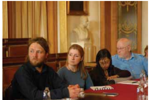
Als de expert van het woord is in een regime gesteund op feiten, is de participatieve burger niet altijd zeer aandachtig.

Als deze uiteenzetting wordt gegeven door deskundigen, voelen de participerende bewoners zich niet altijd betrokken en vinden ze het moeilijk om op hun beurt het woord te nemen.