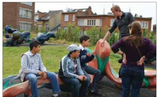
Het onderzoek ter plaatse bij de concrete gebruikers kan nuttig blijken voor de bepaling van het actieprogramma.

Er moet dus worden op toegezien dat de participatie zich niet beperkt tot specialisten, dat er meer mensen het woord grijpen en dat er ook niet-deskundigen, bewoners, aan het woord komen. Deze laatste kunnen overigens ook specialisten zijn op bepaalde gebieden. Zo weten skaters perfect hoe een skatepark aangelegd moet worden. In dit opzicht kunnen bezoeken ter plaatse of onderzoeken buiten erg nuttig zijn bij de identificatie van de vereiste acties.