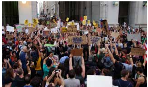
We are the 99%.

Maar dit stelsel van democratische uitdrukking van de gemeenschap heeft grenzen, bijvoorbeeld wanneer in het kader van de 'Overige agendapunten' van de gemeenteraad, behoeftigen en armen gedurende twee minuten mogen spreken voor een bijna lege zaal en gêne veroorzaken.