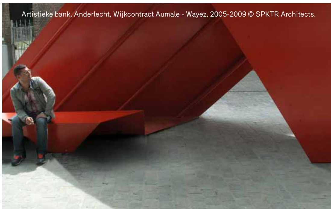
Artistieke bank, Anderlecht, Wijkcontract Aumale - Wayez, 2005-2009

In dezelfde gedachtegang werden op verschillende plaatsen in Anderlecht “artistieke banken” geïnstalleerd om onbeduidende ruimten om te vormen tot stedelijke salons (zie foto hieronder). Voor het ontwerp van deze banken werd een wedstrijd uitgeschreven. Niet alleen het esthetische resultaat (de banken zijn origineel en echte blikvangers), maar ook de manoeuvrekunst is hier interessant: uitsluitend met voorwerpen die het midden houden tussen kunst en stadsmeubilair, werd de wegruimte zelf omgevormd en geherwaardeerd zonder al te veel financiële kosten.